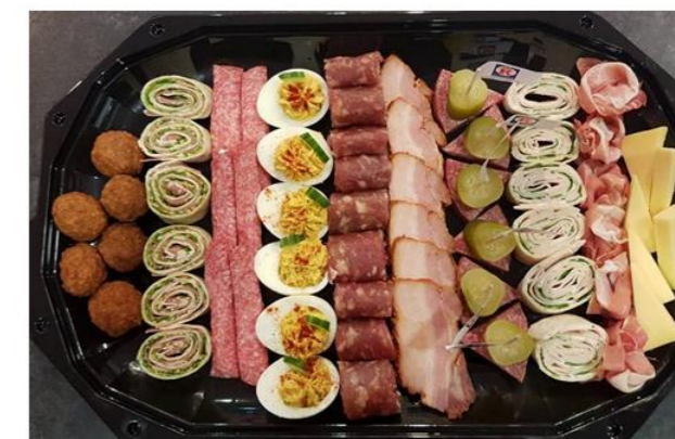
Hapjesschaal 10 Personen