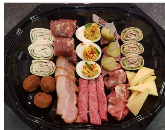
Hapjesschaal 5 Personen